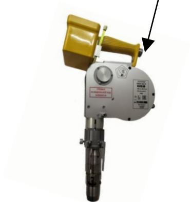
ПЛОТ-3Б-1Р Рисунок 1г