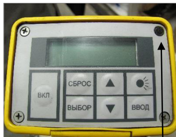
знак поверки ПЛОТ-3Б-1Р Рисунок 2б