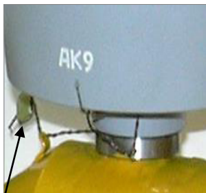
знак поверки ПЛОТ-3М Рисунок 2а