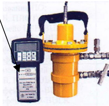
ПЛОТ-3Б-1П исполнение 1 Рисунок 1д