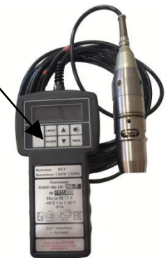
ПЛОТ-3Б-1П исполнение 2 и 3 Рисунок 1е