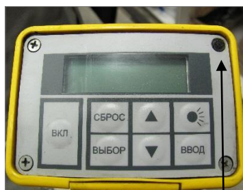
знак поверки ПЛОТ-3Б-1Р Рисунок 2б