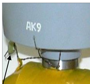
знак поверки ПЛОТ-3М Рисунок 2а