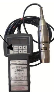
ПЛОТ-3Б-1П исполнение 2 и 3 Рисунок 1е