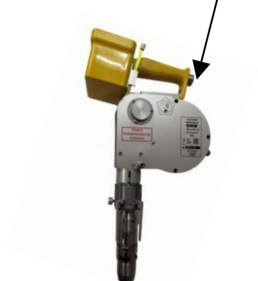
ПЛОТ-3Б-1Р Рисунок 1г