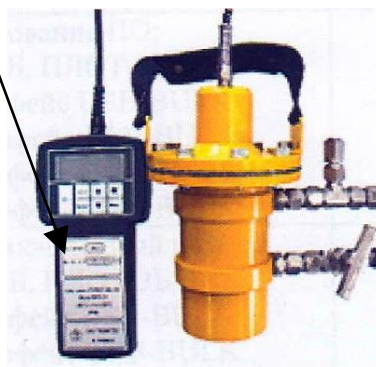
ПЛОТ-3Б-1П исполнение 1 Рисунок 1д